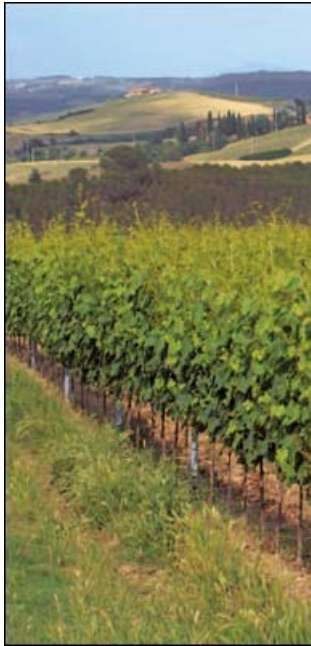
Il panorama delle Crete senesi visto dall'abbazia di Monte Oliveto.