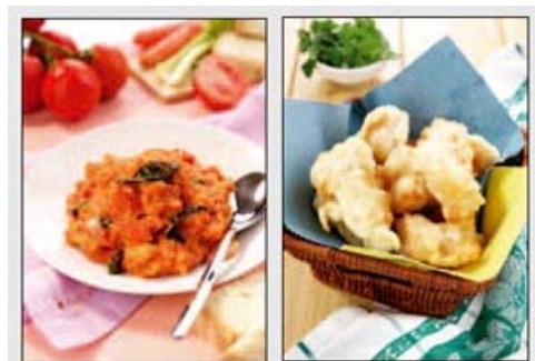
Due delle ricette presenti nel settimo volume della nostra serie; da sinistra: la "pappa col pomodoro", piatto tipico della cucina povera toscana, e le "frittelle di baccalà".

Anche gli affreschi parlano di frugalità, a cominciare dall'episodio in cui san Benedetto, rimprovera i monaci, rei di aver mangiato fuori dal monastero serviti a tavola da avvenenti fanciulle.