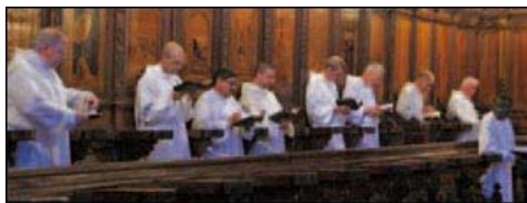
Gli Olivetani durante la preghiera nel coro della chiesa abbaziale, intarsiato da fra Giovanni da Verona.

I piatti della cucina povera toscana si possono trovare nel menù del ristorante collegato all'abbazia, anche se molti turisti non rinunciano alla tradizionale fiorentina cotta alla brace. I poderi adiacenti al monastero ospitano anche un agriturismo con una vista mozzafiato sui vigneti.