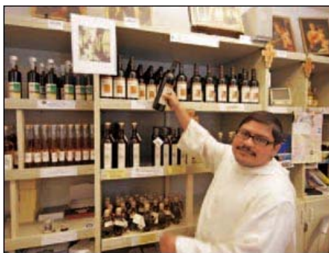
La bottega dove i monaci vendono ciò che producono.

«L'abbiamo concepito come una casa vacanze e siamo molto contenti di metterlo a disposizione delle famiglie che vogliono visitare questa zona, anche perché i prezzi degli alberghi e degli agriturismi da queste parti sono alle stelle», continua l'economista. «Purtroppo abbiamo poche stanze, che vanno prenotate con mesi di anticipo, ma contiamo di ristrutturare anche gli altri casali e i capanni dei contadini, oggi inutilizzati. Aspettiamo il permesso del Comune e della Soprintendenza».