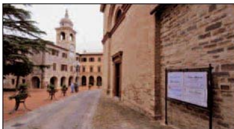
La piazza del paese, dove le Clarisse sono ospitate in un palazzo.