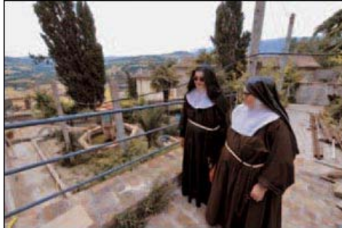
Le Clarisse di San Lorenzo a Belforte del Chienti ispezionano il cantiere del loro convento, lesionato dal terremoto del 1997.

Da allora la foresteria è aperta ai gruppi e alle famiglie. «Molti ospiti partecipano alla nostra preghiera e, specialmente durante i ritiri, ci chiedono di preparare il pranzo o la cena». L'idea era quella di fare una grande festa, in occasione della riapertura del convento, ma l'entusiasmo delle Clarisse si è smorzato. Un po' per i continui ritardi del cantiere, un po' per la brutta sorpresa che hanno trovato una mattina.