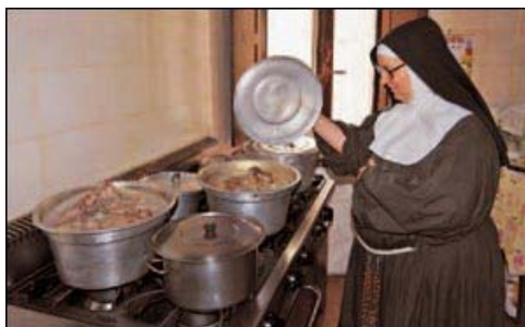
Una suora in cucina.

Anche in questa sistemazione di fortuna hanno mantenuto i ritmi della loro vita. La preghiera, il lavoro, la cucina. Il loro è un sistema democratico e tutte quante si alternano ai fornelli, compresa la superiora. Oggi hanno preparato tagliatelle e tagliolini, da far "seccare" e poi consumare un po' alla volta.