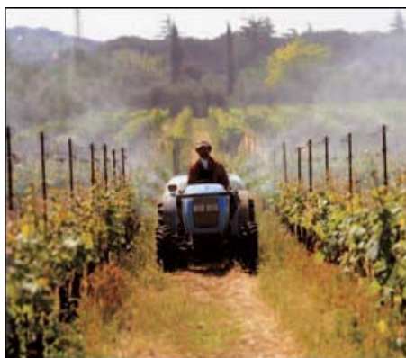
Un monaco al lavoro nella vigna delle Frattocchie.