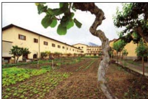
Uno scorcio dell'orto che le suore curano.

Una cena cui hanno partecipato anche le monache, nonostante la clausura. «Nel nostro ordine i monasteri godono di una certa autonomia, comunque la Regola di san Benedetto ce lo permette. Raccontano che una volta vennero a dirgli che c'era un uomo che si era incatenato per amore di Dio. Lui disse di andare a liberarlo. "Deve essere l'amore di Dio a trattenerci, non una catena". Voleva che il monastero fosse autonomo, ma i monaci si muovevano per comprare e vendere i prodotti, quindi era previsto uno scambio con l'esterno. A un certo punto, in un determinato momento storico, la Chiesa ha introdotto la clausura. Ma come Cristo si è incarnato, anche noi dobbiamo vivere nella nostra realtà, secondo quelle che sono le nostre concrete possibilità. La cosa essenziale, per chi sceglie il nostro abito, è la ricerca di Dio».