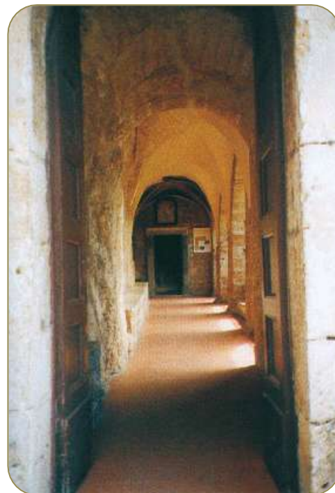
Subiaco. Monastero del Sacro Speco di San Benedetto. Il corridoio coperto subito dopo l'ingresso

La Regola benedettina con le sue esigenze di ordine, di stabilità, di sapiente equilibrio fra preghiera e lavoro, si impose ben presto a tutto il monachesimo occidentale e fu seguita in tutti i Monasteri europei. San Benedetto divenne così uno dei Santi più popolari e venerati e apparve a tutti come l'uomo suscitato da Dio per portare la pace là dove erano state seminate le distruzioni e la morte. Divenuto il simbolo dell'ideale monastico, fu spontaneo attribuire a lui il merito di tutto ciò che il monachesimo, compreso quello pre-benedettino e quello extra-benedettino, aveva compiuto a servizio della civiltà. Così nel 1947, Pio XII lo chiamò «Padre dell'Europa» il 24 ottobre 1964, in coincidenza con la consacrazione della basilica di Montecassino, ricostruita dopo la distruzione della seconda guerra mondiale, Paolo VI lo proclamò «patrono d'Europa»