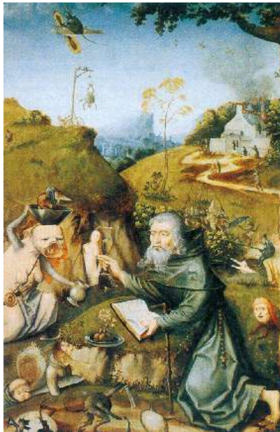
Hieronymus Bosch, Tentazioni di Sant'Antonio Trevi, Stadtmuseum

digiuni e penitenze di ogni genere, riuscendo sempre a trionfare. La sua fama di anacoreta si diffuse ben presto presso i fedeli e Antonio, che voleva vivere assolutamente distaccato dal resto del mondo, fu costretto più volte a cambiare luogo di residenza. Intorno al 311 si recò ad Alessandria per prestare aiuto e conforto ai cristiani perseguitati dall'imperatore Massimiliano; poi si ritirò sul monte Qolzoum, sul Mar Rosso, ma dovette tornare ad Alessandria poco tempo dopo per combattere l'eresia ariana, sempre più diffusa nelle zone orientali dell'impero. La vita monastica, dunque, non costituisce un volontario isolamento dalla più ampia azione e vita della Chiesa, ma ne rappresenta una forma peculiare, che contribuisce alla sua estensione e al suo rafforzamento.